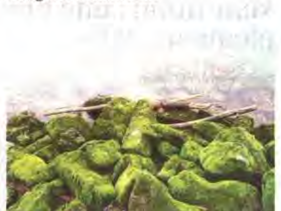
Un cliché original sur l'origine du bois flotté.

Évian-les-Bains • La photo flottine du jour est signée Patricia Bertail