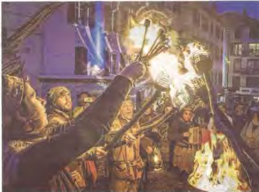
Les feux follets flottins sont là ou on ne les attend pas, pour des performances autour du feu. Messenger

Côté musique, cette année un flottin joueur de djedjour