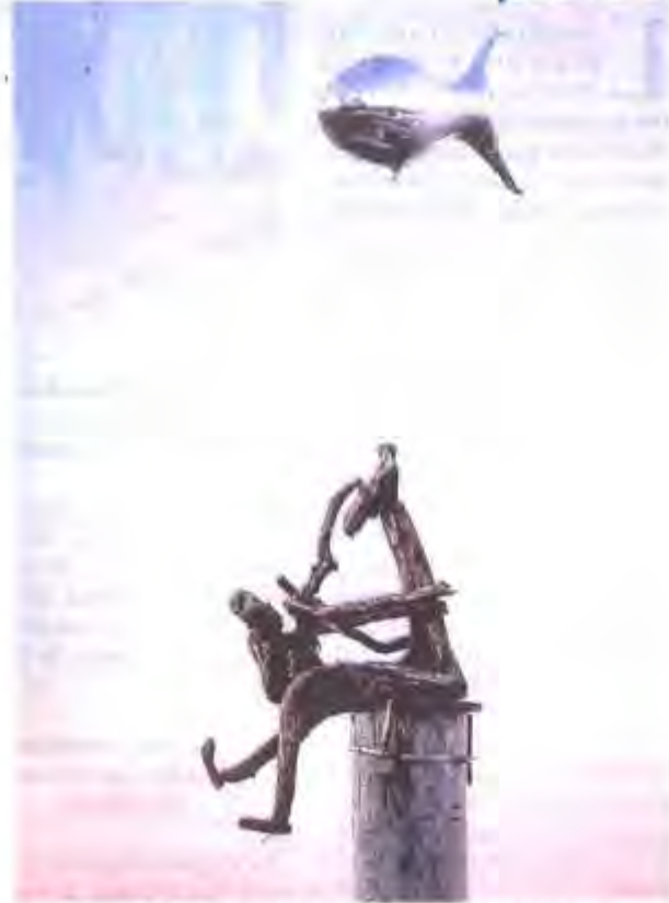
Le retour des sardines volantes.