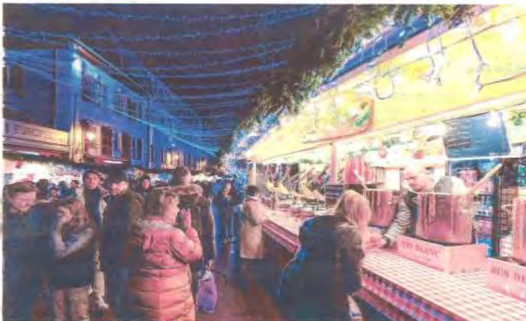
La saison des marchés de Noël est ouverte. Comme chaque année, les chalets en bois illuminent les centres-villes. Une période d'intense activité économique très attendue par les communes et les exposants.