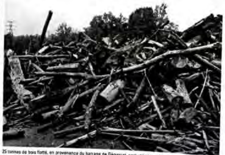
25 tonnes de bois flotté, en provenance du barrage de Génissiat, sont utilisées, chaque année, pour réaliser des sculptures.