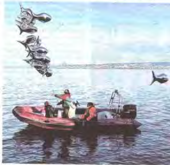
Il faut composer avec la météo et disposer d'une équipe qualifiée de la capitainerie et de la Toupine pour mettre en place le banc des sardines volantes.

Et comme la météo n'est pas très stable cette année encore, et que leur installation nécessite une mobilisation des services de la capitainerie, associées à des intervenants de la Toupine, leur retour ne se fait pas d'un simple claquement de doigts. Leur