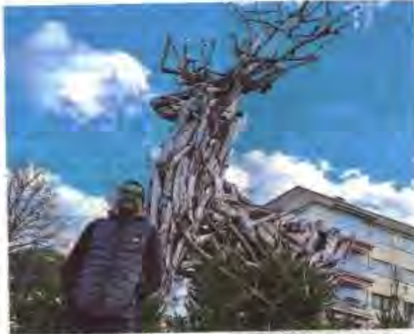
Vanly Tiene réalise chaque année depuis 2016 une vingtaine de sujets pour faire vivre la magie du Fabuleux village.

Les premiers jours consacrés à la technique, il se familiarise avec la triangulation, la répartition des charges, l'assemblage... « C'est un vrai travail d'architecture, ça doit être costaud et esthétique ». Suivent les tra-