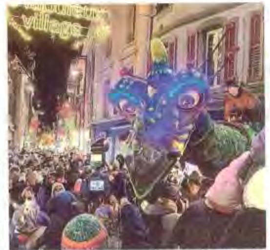
Au milieu d'une foule très dense composée essentiellement de familles, le dragon géant a fait sensation avec sa taille de plus de 10 mètres et ses énormes yeux bleus.

Et si vos enfants vous demandent pourquoi le père Noël arrive si tôt, alors parlez-leur de la légende d'un soir de décembre, il y a bien longtemps, alors que le père Noël survolait le lac pour un vol d'entraînement, une cha-