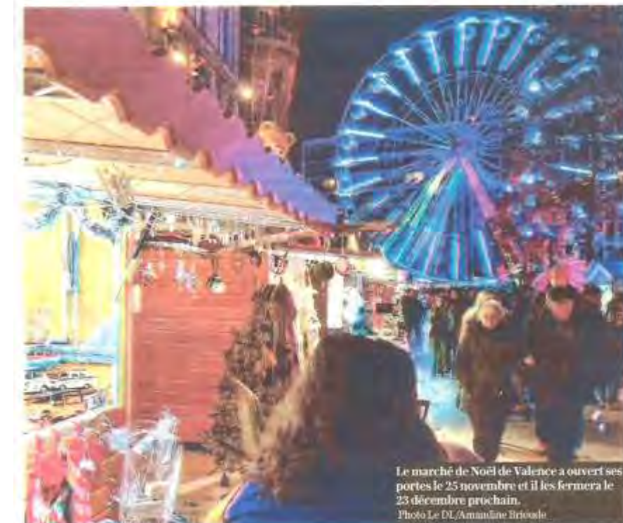
Le marché de Noël de Valence a ouvert ses portes le 25 novembre et il les fermera le 23 décembre prochain.

Une part de tartiflette dans une main emmitouflée, un chocolat chaud dans l'autre... Pour patienter jusqu'au 25 décembre, de nombreuses communes accueillent un marché de Noël. Il y en a même de plus en plus. « Aujourd'hui, dans toutes les grandes et moyennes villes, on en trouve et ils sont bien mieux achalandés et plus ambiteux, en termes de diversité de l'offre, qu'il y a quelques années », observe l'économiste Hugues Puisseux.