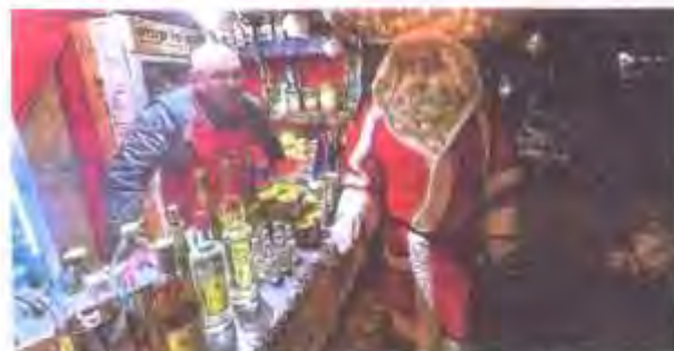
Le père Noël a fait une brève apparition mardi au Repaire des Gourmands.

Un petit tour et puis s'en va ! Le Repaire des Gourmands avait souhaité avoir son père Noël pour animer son espace et attirer des familles. Sa présence était annoncée du lundi 18 au dimanche 24 décembre. Une initiative qui a tourné court. Le lundi, le père Noël a fait faux bond pour convenance personnelle et le lendemain, sa présence était jugée "père Noël non grata" par l'organisation qui voulait éviter une collusion avec un autre père Noël qui était, lui, très attendu dès le lendemain, mercredi 20. Une situation qui s'est vite résolue entre gentlemen, le père Noël du Repaire des Gourmands a très vite repris ses habits du quotidien dans la foulée et dans la bonne humeur.