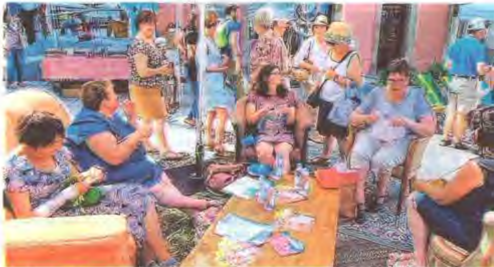
Papotages et créations au menu de cet après-midi du tricot qui sera animé par les tricoteuses de Flottins, le tout dans la convivialité, au beau milieu de la place Charles de Gaulle.

Les Flottins pensent déjà à l'édition 2023-2024 du Fabuleux Village, et notamment aux tricots qui seront vendus à la boutique. Un appel aux tricoteuses est lancé.