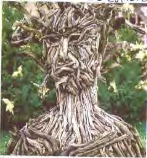
Un superbe buste en bois flotté.