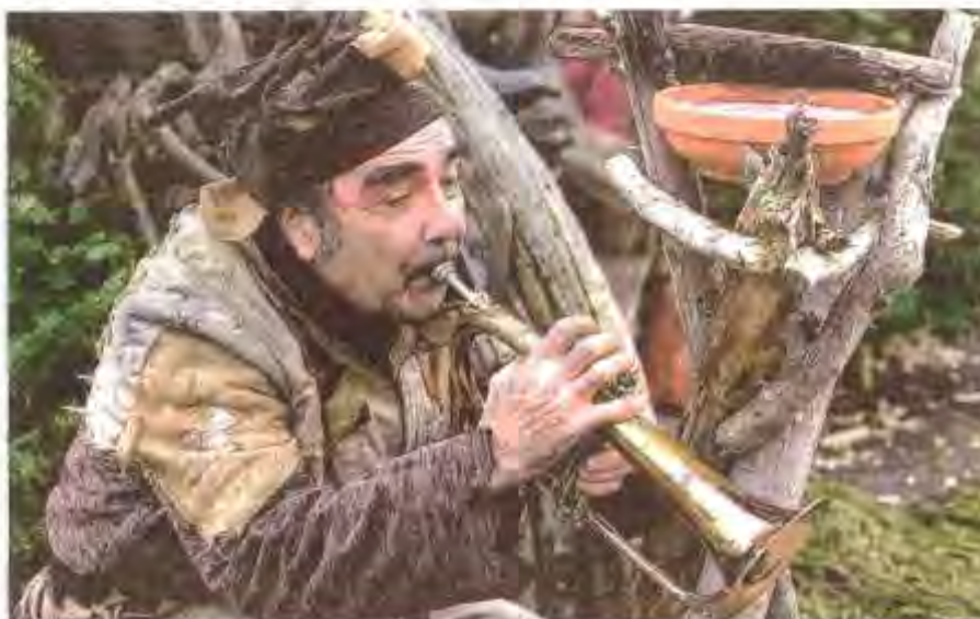
De par sa musique, ce trompettiste enchante petits et grands.