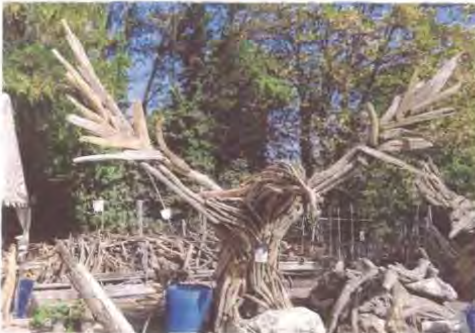
Michel travaille sur les grandes pièces, comme cet aigle, nouveauté de l'année en cours de finalisation.

Chaque année, les nombreux bénévoles présents sur les divers fronts permettent à la fabuleuse aventure des Flottins de continuer, en toute humanité. Témoignages.