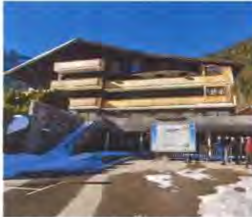
L'hôtel Le Stella va reprendre du service.

L'hôtel Le Stella , propriété du ministre des Finances, vient d'être acheté par la commune de Châtel. Cette dernière est désormais à la recherche d'un exploitant pour cet établissement hôtelier d'une quarantaine de chambres situé à proximité des domaines skiables du Linga et de Prê la Joux. Il est possible de candidater jusqu'au 8 janvier prochain.