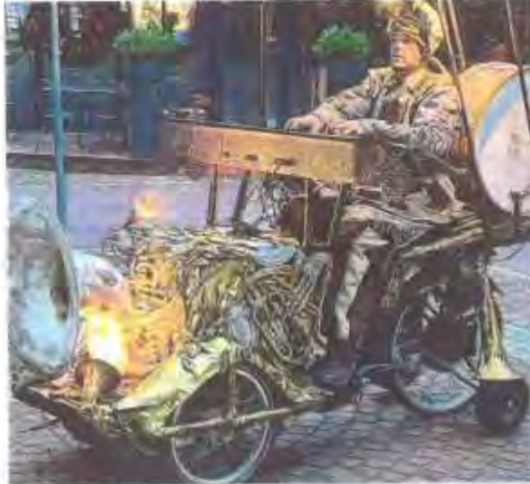
Derrière son habit de Flottin sur son triporteur musical à roulettes, Aimé Charmot est un jazzman reconnu, mais aussi un producteur lyonnais de musique de jazz.

En parallèle à cette activité, il a rejoint le Théâtre de la Toupine, l'année dernière, avec lequel il se produira un peu partout, dans des festivals en Suède, en