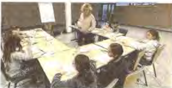
L'unique atelier du vendredi 29 décembre a réuni une dizaine de jeunes dessinateurs.

La seconde série de trois ateliers aura lieu, à 10 heures, 11 h 30 et 14 heures, toujours salle Brunnarius ce vendredi 5 janvier, animés cette fois par Miss Prickly, illustratrices des