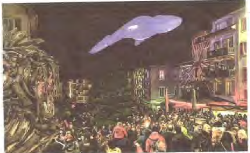
Les Flottins font leur retour ce vendredi soir.