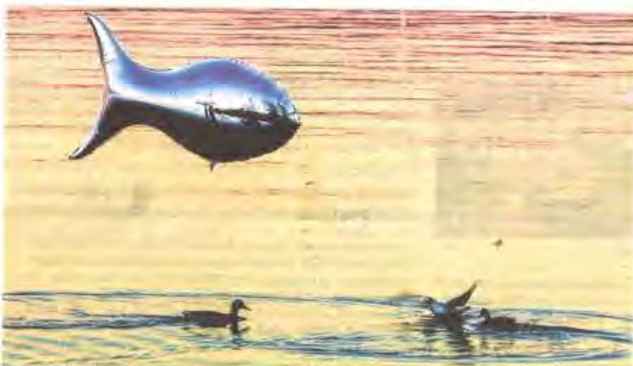
Un cliché poétique d'une sardine volante au-dessus de vrais canards.