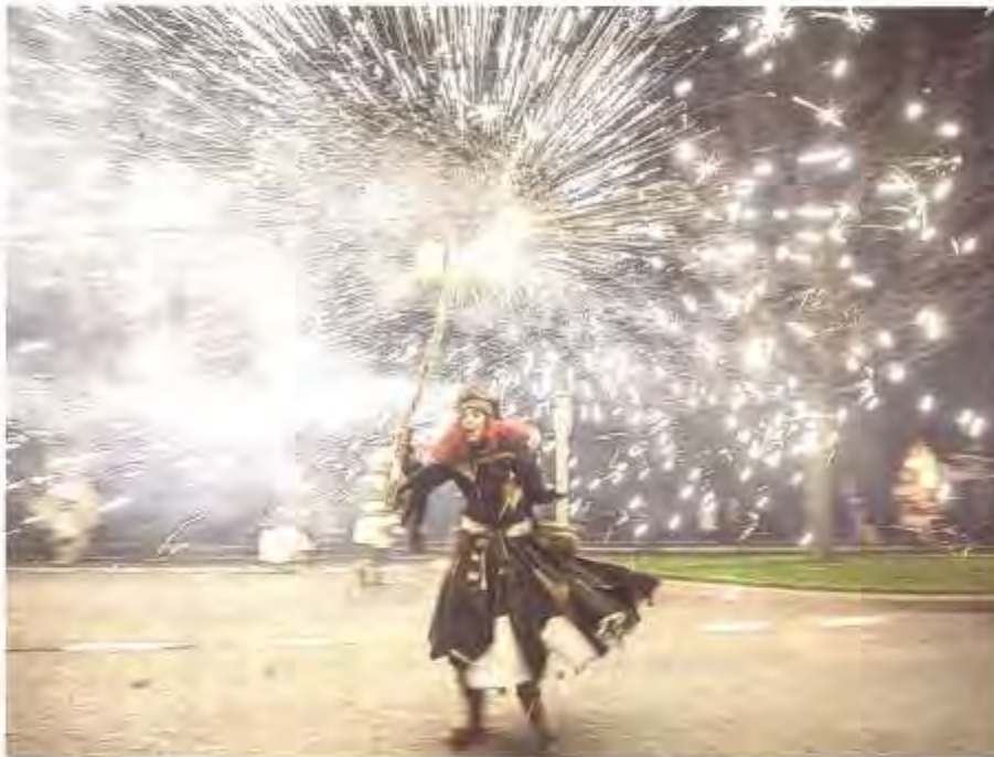
L'arrivée des flottins marque le début d'une grande aventure de trois semaines de convivialité. Sébastien Dourant

Ici, pas de clichés, chaque bois flotté ramassé a trouvé sa place afin de faire naître un nouveau flottin, sous l'inspiration et l'habile talent des sculpteurs. Dans cette incroyable aventure, chaque flottin "vivant" partage ses qualités avec le public ; ainsi, entre sculptures monumentales, contes originaux, mines, performances circassiennes, musique intimiste ou