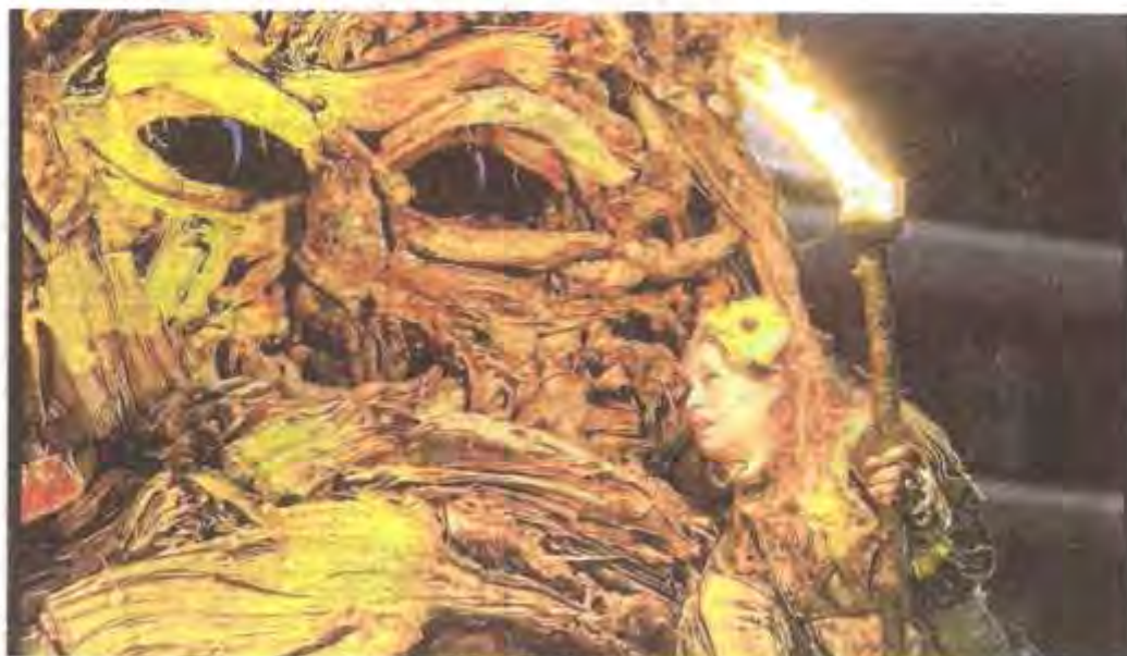
Les sculptures géantes faites de bois flottés chuchotent parfois aux oreilles des villageois.