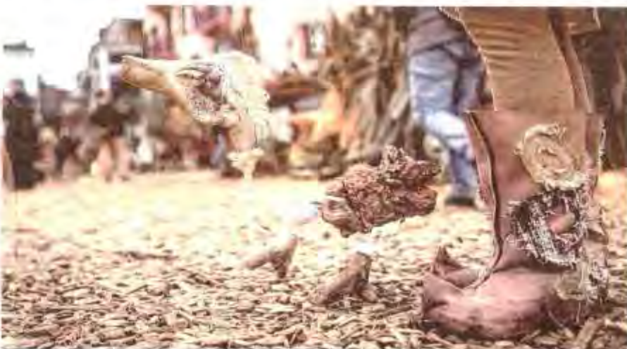
Une marionnette originale en bois flotté.