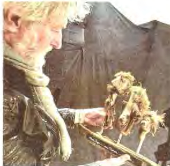
« C'est le bois qui commande l'imagination... »

C'est via l'association Sourdi-ne la vie qu'il prend contact pour la première fois avec le patron de la compagnie d'Alain Benzoni. « Dans l'esprit de l'association, nous voulions mettre l'accent sur l'accessibilité des personnes sourdes ou malentendantes ». Au nombre des actions et animations mises en