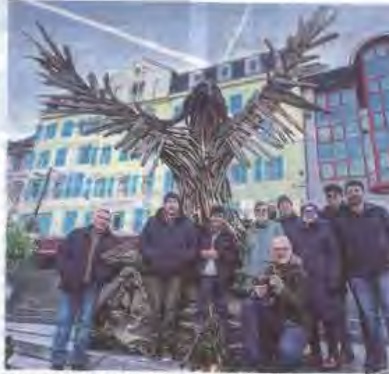
Une partie des Bacoutins devant leur sculpture : un magnifique aigle royal, qui trône comme il se doit en haut du Fabuleux village.

Sans lien direct avec ce coup de massue, et comme chaque année, une partie de cette joyeuse troupe de marins d'eau douce, bénévoles dans l'âme sur terre comme sur l'eau, ont accompagné