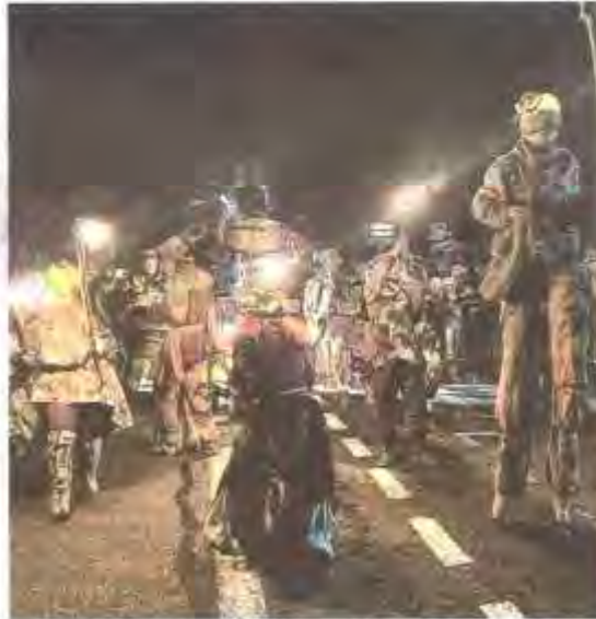
La traditionnelle déambulation des Flottins dans la cité lacustre a lancé la 17 e édition de l'événement.

Les Flottins ont pris possession pour trois semaines de leur fabuleux village, entourés par les nombreux enfants qui composaient une bonne