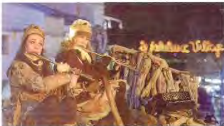
Des pauses musicales où et là sont à découvrir et à apprécier tout au long de l'événement des Flottins.

Au fabuleux village des Flottins à Evian-les-Bains, il y en a de tous les goûts et toutes les couleurs pour passer de bonnes vacances récréatives.