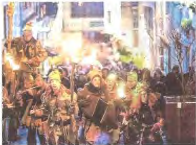
Les Flottins débarquent le 19 décembre et prendront possession de leur fabuleux village.

Cette édition se calera sur les vacances scolaires d'hiver avec cinq temps forts : l'arrivée des Flottins le 15 décem-