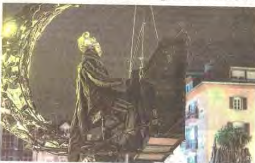
Le pianiste volant des Flottins. Photo Bernard Brun

La photo Flottine du jour est signée Bernard Brun