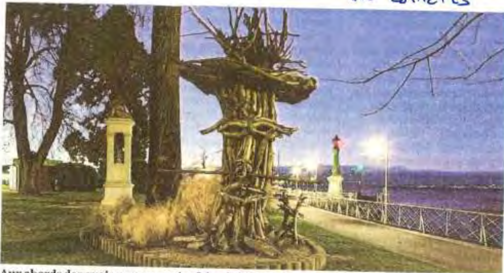
Aux abords des quais, vous pourriez faire de bien curieuses rencontres...