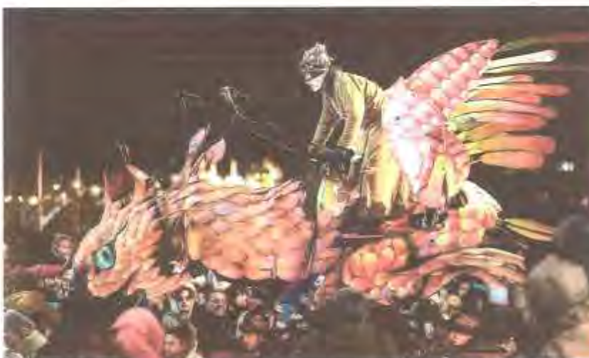
Ce cliché représente l'arrivée du phénix qui accompagnait, vendredi 15 décembre, l'arrivée des Flottins.