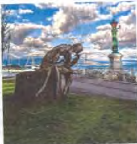
"Le penseur de rondins" : il fallait y penser !

Évian-les-Bains • La photo flottine du jour est signée Philippe Chaffard