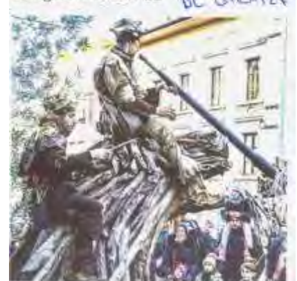
Un drôle d'équipage avec un joueur de didjeridoo sur la tête de cette sculpture. Photo Anne Colliard

Évian-les-Bains • La photo flottine du jour est signée Anne Colliard DL 01/01/24