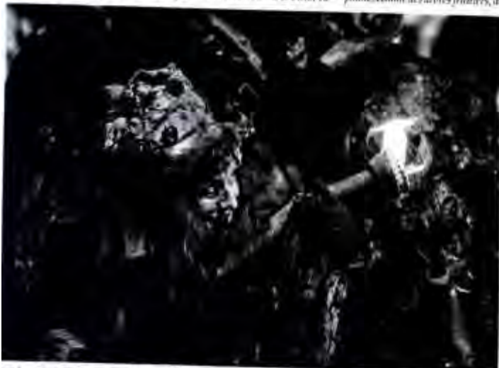
Les facétieux flottins animent la ville d'Evian.