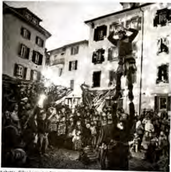
Sculptures en bois flotté et spectacles divers sont à admirer, à Evian, jusqu'au 7 janvier.