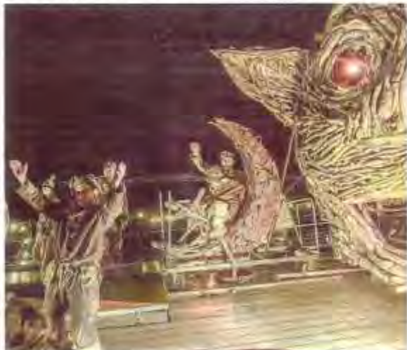
Devenez sculpteur le temps d'apporter votre contribution à la grande sculpture participative mise en place chez les Flottins.

Billetterie : www.lefabuleuxvillage.fr Programme complet sur www.lesflottins.com