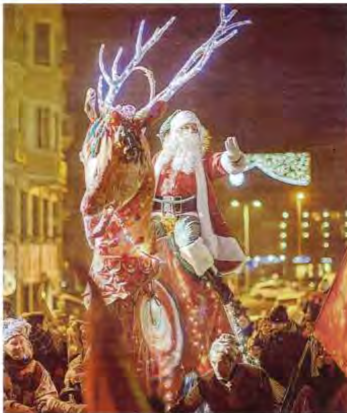
L'arrivée du Père Noël, un moment magique du Fabuleux village (mercredi 20 dès 18 heures, av. Jean Léger).