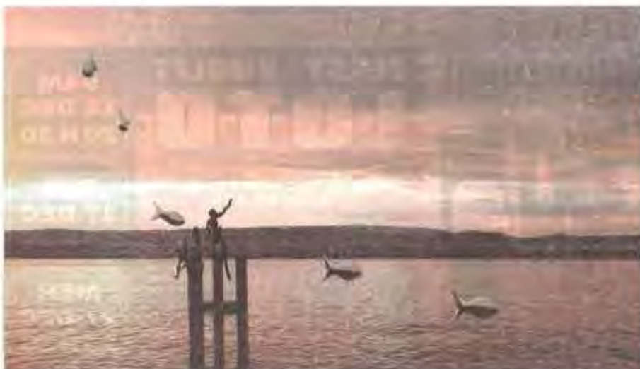
Comme ce banc de sardines, l'instant est suspendu.