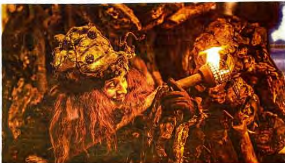
Chaque année, les Flottins charrient leur lot de curieux et de spectateurs enchantés.

L'édition 2024, dont les dates devraient être connues dans un mois, promet des spectacles de haute voltige puisque le fabuleux village des Flottins fera son cirque ! La 18 e édition s'annonce encore folle, hors des sentiers battus, avec du cirque, du trapèze et plein d'autres surprises.