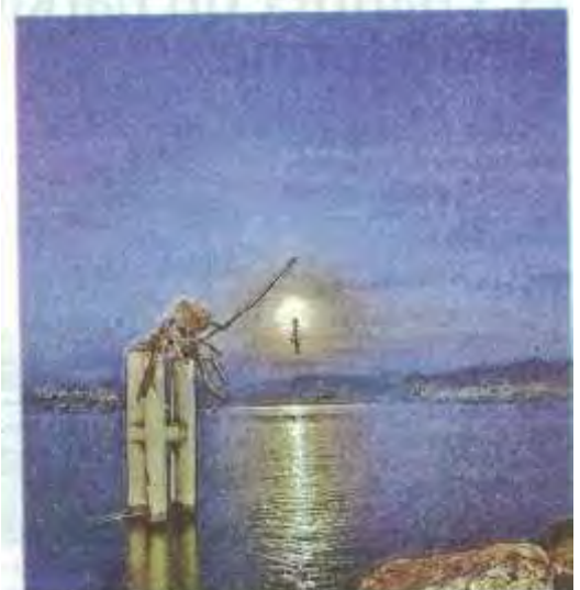
Un superbe cliché poétique.