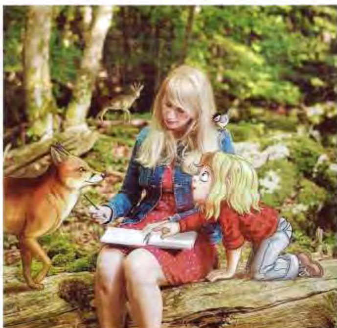
Miss Prickly animera des ateliers dessin sur le thème "Monstres de nos montagnes".

- Vendredi 5 janvier avec Miss Prickly, ateliers dessins sur le thème "Monstres de nos montagnes". Plusieurs horaires : 10 h, 11 h 30 et 14 h. Suivi d'une vente et séance de dédicace de 15 h 30 à 18 h à la librairie du Muratore. Les ateliers se déroulent à l'espace Brunnerius, dès 7 ans. 15 euros sur inscription. Billetterie sur www.lefabuleuxvillage.fr