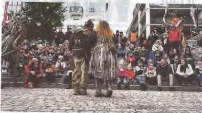
Un angle original pour ce cliché.