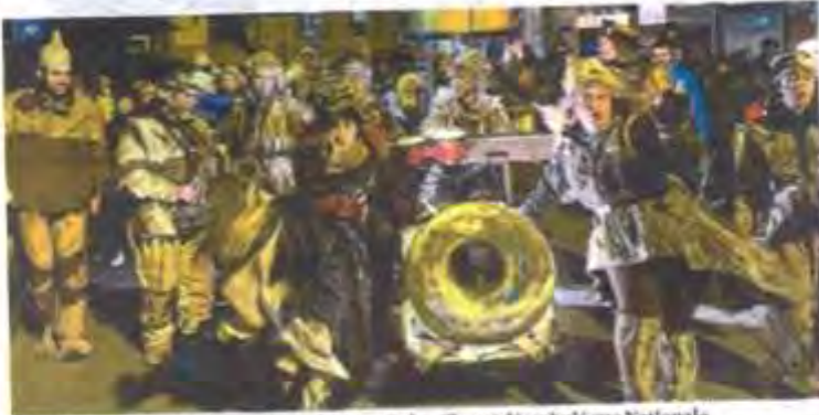
Les Flottins ont quitté leur village et c'est à pied qu'ils ont déambulé rue Nationale, accompagnés d'un nombreux public, avant de disparaître à vélo du côté de l'avenue des Grottes.

La 17 e édition du Fabuleux village des Flottins s'est achevée dimanche soir. Un simple au revoir avant leur retour en fin d'année sur le thème du cirque.