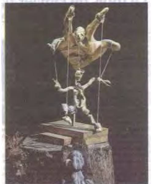
Joli cliché d'une création de Jean-Pierre Fuchs, "La manipulation", exposée dans l'antre des Flottins.

Evian-les-Bains • La photo flottine du jour est signée Céline Pierront