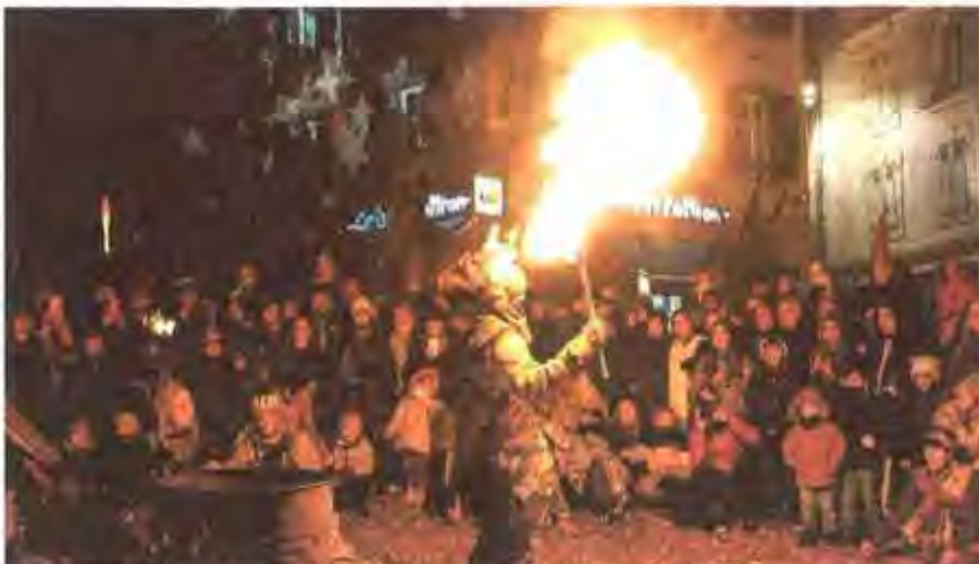
Cliché du cracheur de feu.