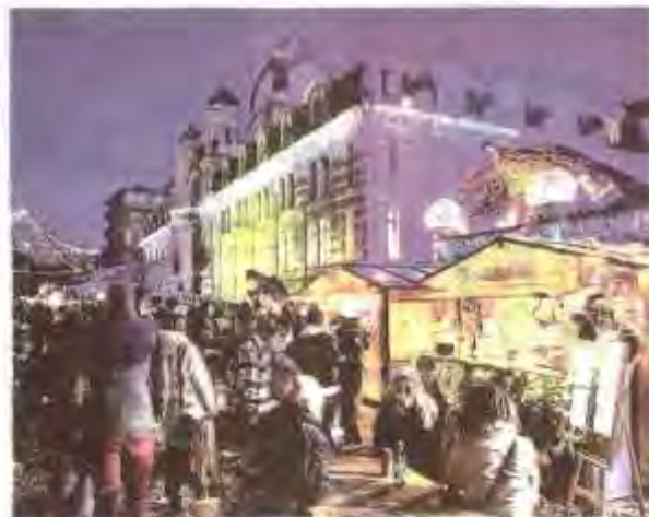
Le Repaire des Gourmands, installé devant la mairie, offre un espace chaleureux aux visiteurs. Autour de ses chalets, il accueillera les trois soirées musicales, à la belle étoile.

À proximité, devant le Palais Lumière, une "Piste aux étoiles" a été aménagée pour accueillir les amateurs de roller, pratiquants ou débutants qui bénéficieront d'une zone de "premiers tours de roues". Chacun peut y évoluer gratuitement tous les jours, entre 15 et 19 heures (sauf ce lundi 25 décembre et le lundi 1 er janvier). On peut venir avec son propre matériel ou emprunter gratuitement des rollers sur place. Le port du casque et les protections sont recommandés, l'activité n'étant pas encadrée. La piste est néanmoins