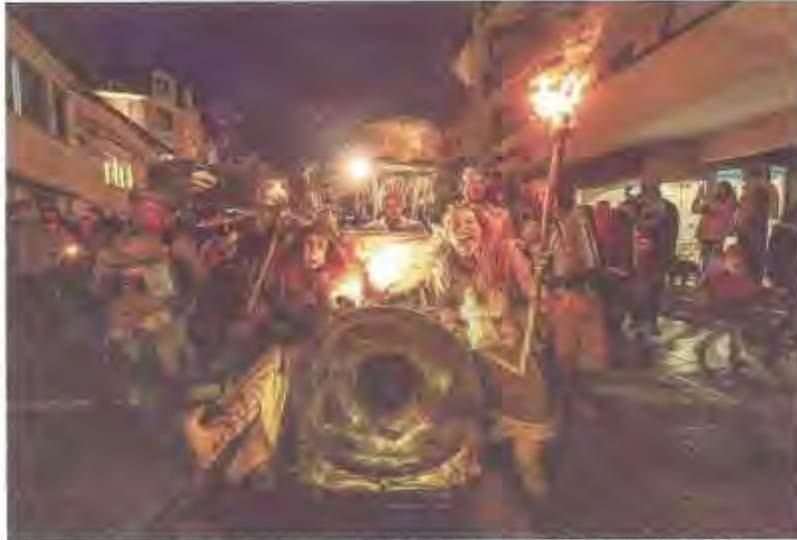
De nombreuses animations se dérouleront pour le Tome 17 des Flottins, du 15 décembre au 7 janvier. Sébastien Doutard

Le Messenger 12 octobre 2023 Hebdomadaire Régional