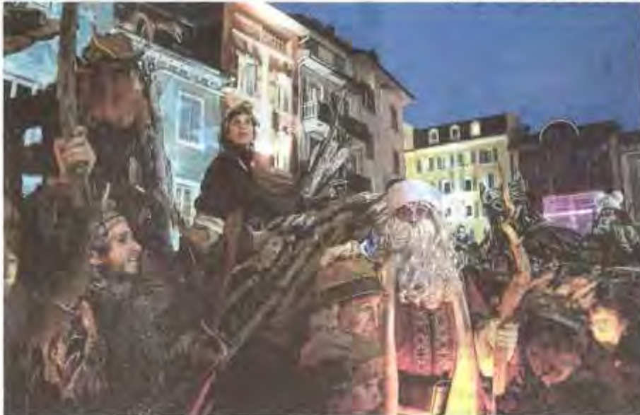
Le père Noël en compagnie de ses amis les flottins.

Dimanche 24 décembre, le père Noël des Flottins s'en est allé pour honorer sa grande tournée de cadeaux. Un départ en grande pompe qui a ravi petits et grands.